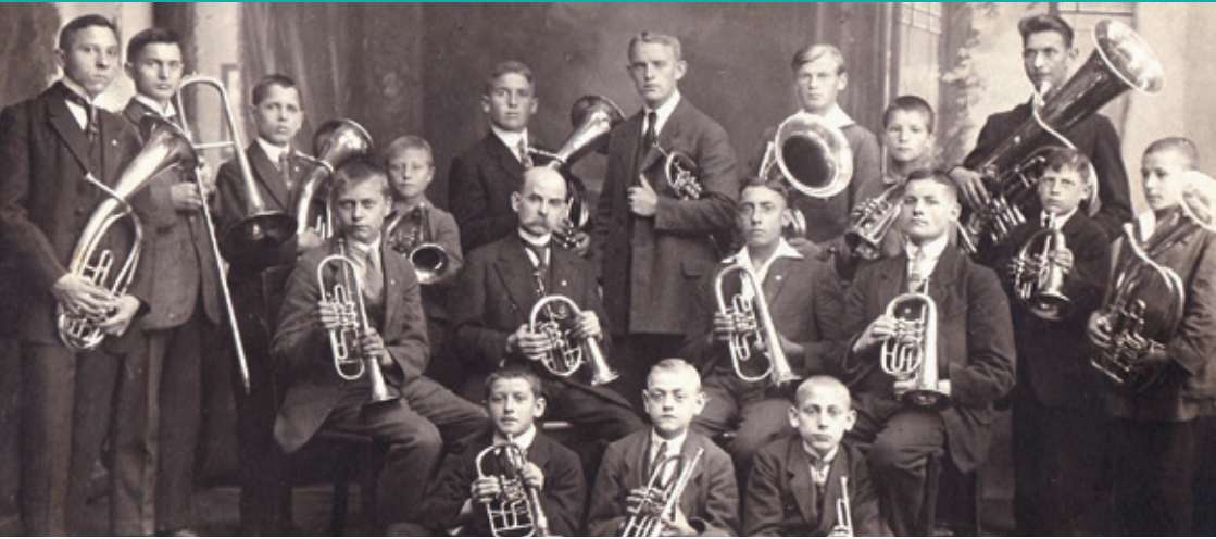
Der Posaunenchor im Gründungsjahr 1920