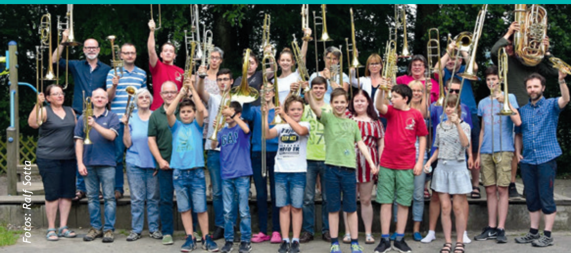
Probenwochenende 2018 – noch immer ein toller Chor